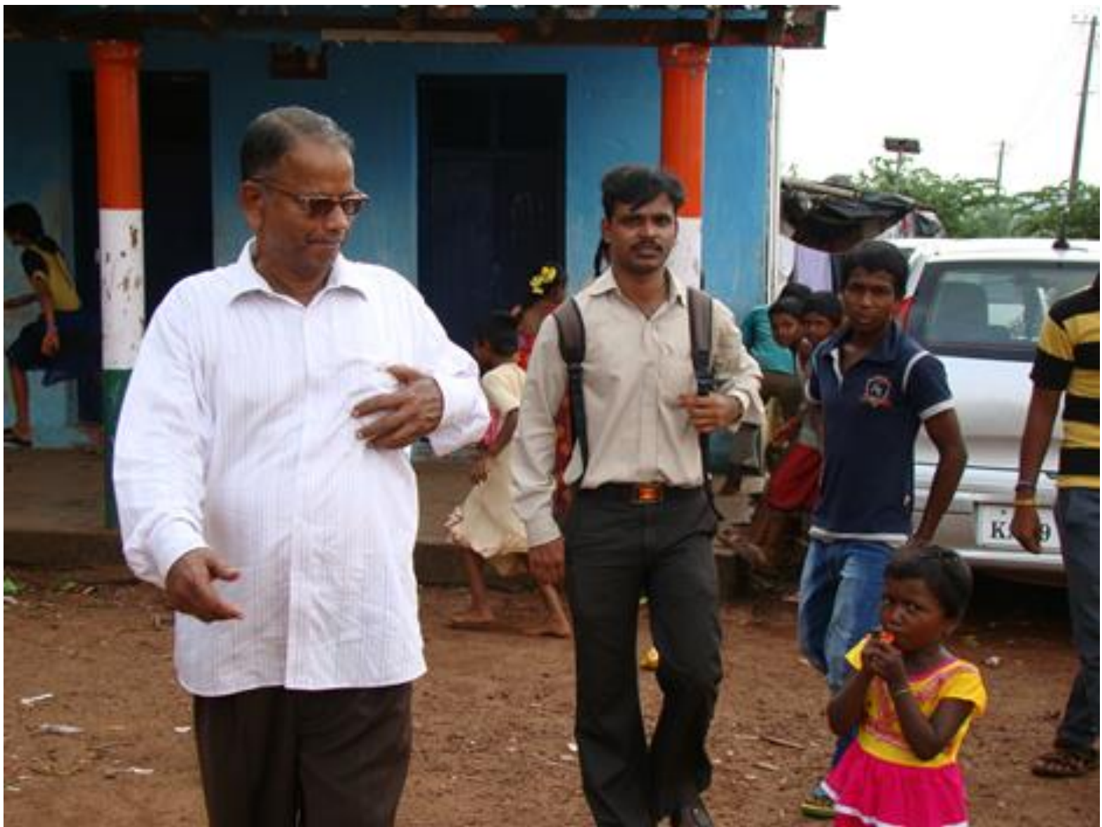
Leader de l'association Gandhi Sevam Ashram, il sillonne avec son équipe les sites des tribus et parle les langues locales.